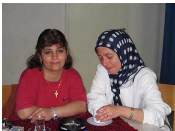
türkische und arabische Frauen im Gespräch beim Elterncafe