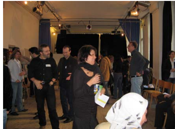
Wochenendseminar im Rahmen der Tage des Interkulturellen Dialogs 2006 im Nachbarschaftshaus Prinzenallee zum Thema: Nachbarschafts- und IntegrationslotsInnen in Berlin, Projektansätze / Praxis / Perspektiven. Veranstaltet von Helle Panke e.V. in Kooperation mit Aric Berlin e.V. und dem Nachbarschaftshaus Prinzenallee.

Bei Veranstaltungen wie etwa einer Reihe von Runden Tischen in der Nachbarschaftsetage Fabrik Osloer Straße lag der Schwerpunkt verstärkt auf der Vernetzung und dem Austausch der Einrichtungen vor Ort, der Zusammenarbeit von Menschen mit Migrationshintergrund und den Institutionen im Kiez. In einem solchen Rahmen lässt sich die gesellschaftliche Diskussion zu Integrationsfragen aufnehmen ebenso wie mit RektorInnen, LehrerInnen, ErzieherInnen oder auch MitarbeiterInnen der Jugendämter, den MitarbeiterInnen verschiedenster Einrichtungen und Projekte vor Ort und BewohnerInnen des Stadtteils Probleme, Vorgehensweisen und Lösungsmöglichkeiten, die die Zusammenarbeit noch verbessern könnten, fachlich diskutieren.