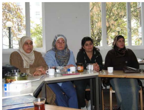
arabische Frauen bei der Veranstaltung: Jugendliche in der Pubertät